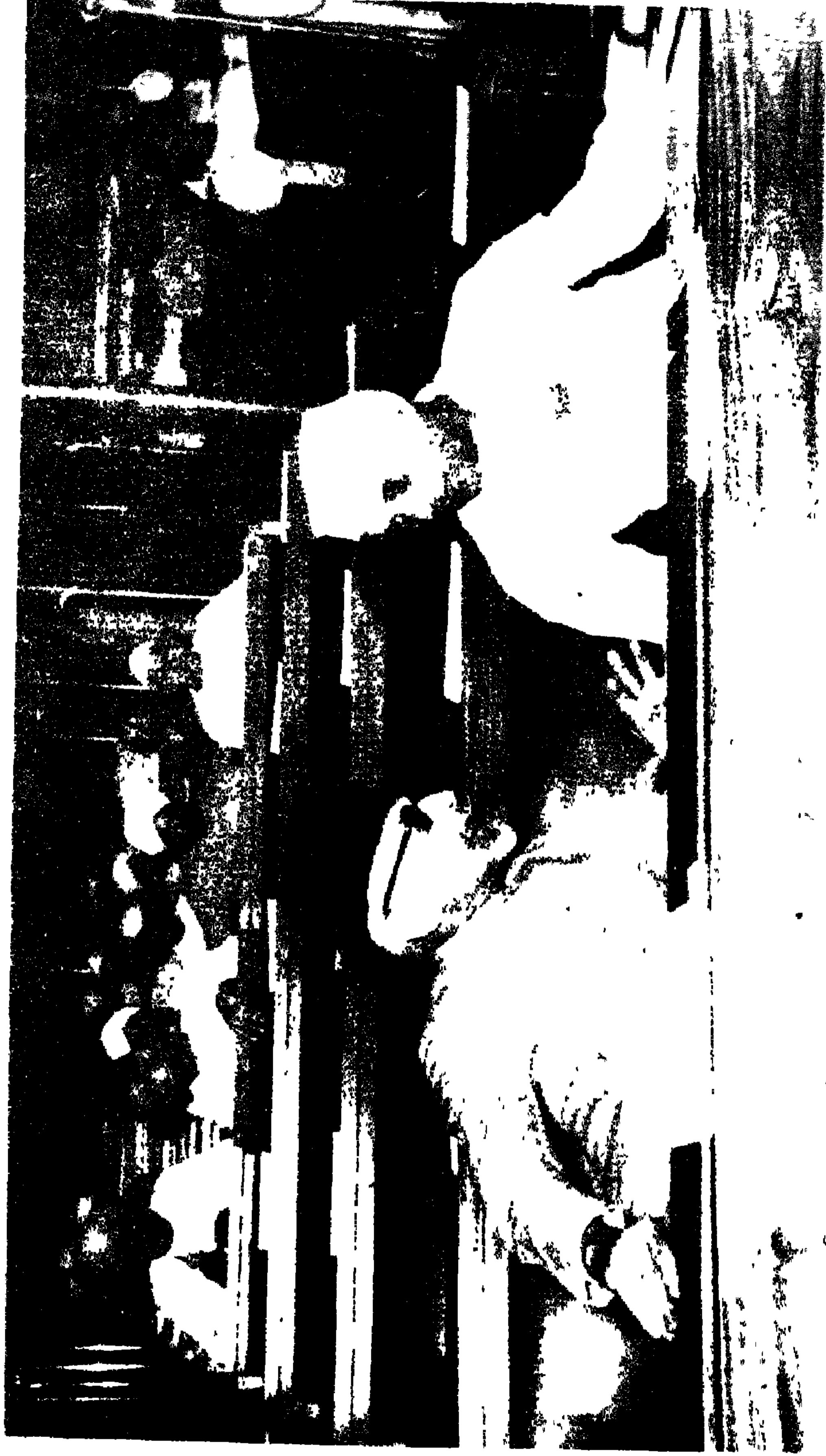
सविधान सभा के सत्र के दौरान मोलाना अबुल कलाम आजाद और पंडित जवाहरलाल नेहरू