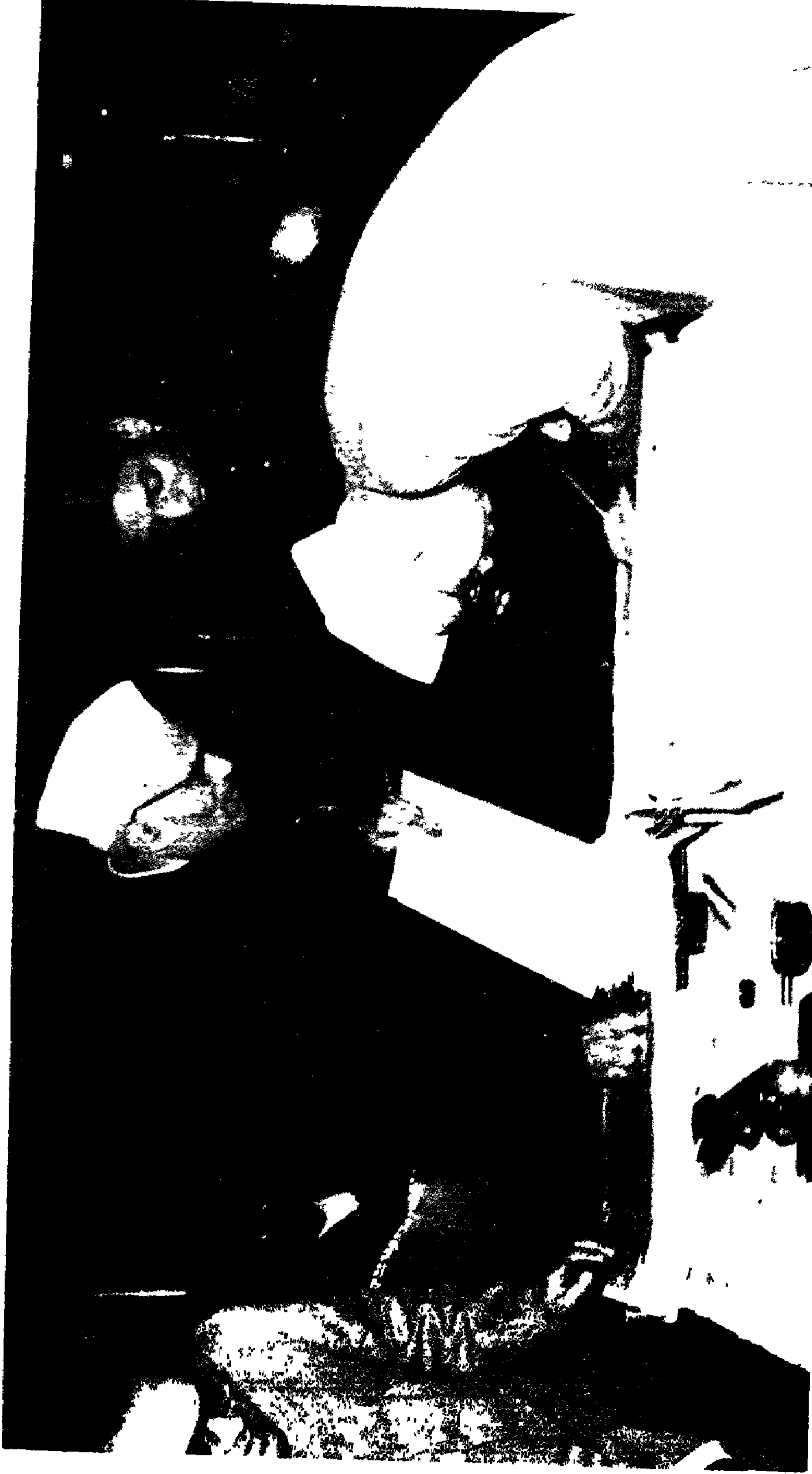
पंडित जवाहरलाल नेहरू सविधान पर हस्ताक्षर करते हुए। उनकी बाईं ओर है, केंद्र में श्री