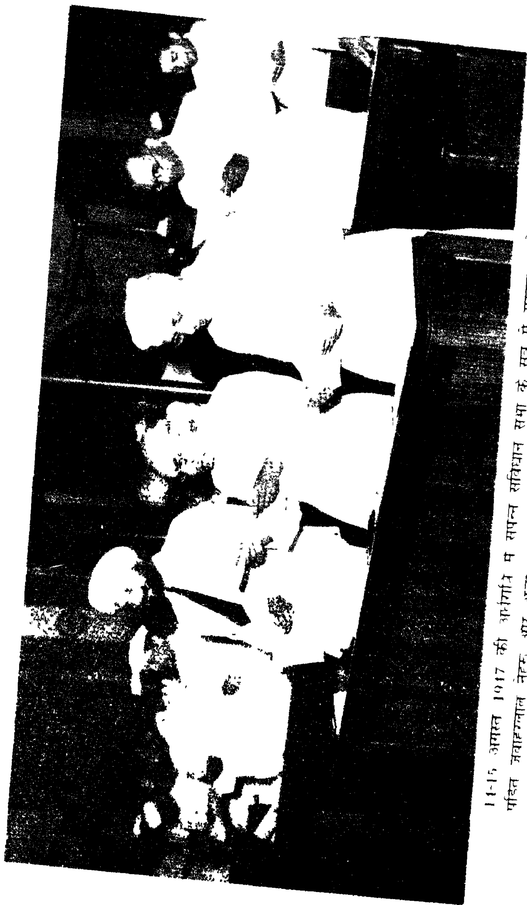
11-15 अगस्त 1947 की अर्धरात्रि में सपन्न संविधान सभा के सत्र में साग्दार बलदेव सिंह, पंडित जवाहरलाल नेहरू और अन्य